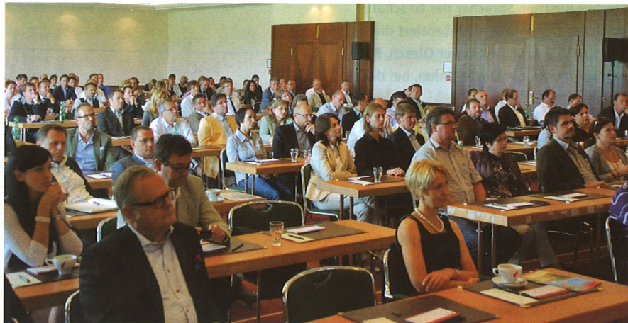
Rund 200 Teilnehmer kamen zum diesjährigen Besko-Kompetenz- und Innovationsforum 2011

Design-Bodenbeläge. „Das Thema Nachhaltigkeit, der Weg in Richtung Qualität sowie die Zielgruppe ‚Silver Generation‘ sind die großen Potenziale der Raumausstattungsbranche“, resümierte Simmer, „mit imagebildenden Maßnahmen werden unsere Mitglieder zum Leuchtturm in ihrer Region.“ Neben den individuell für Besko-Mitglieder zugeschnittenen Pro-